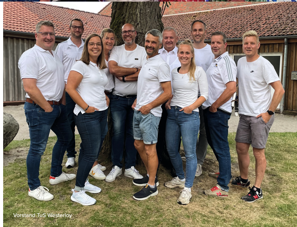
Vorstand TuS Westerloy